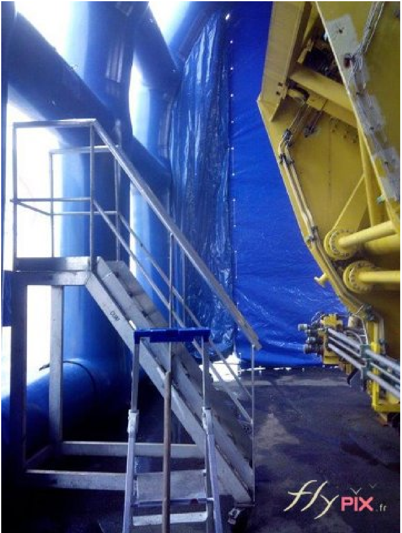
Plate forme avec une machine, à l'intérieure d'une tente gonflable industrielle.